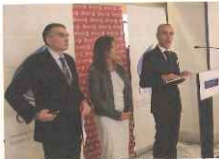
Momento da inauguración do foro