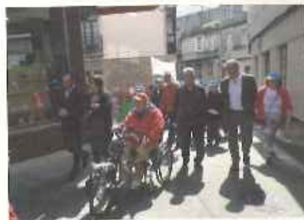
Momento da marcha pola inclusión