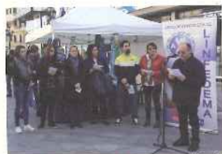
O pres. de AGL lendo o manifesto